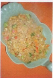
53. Khao Pad Pag Raum