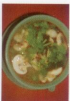
33. Tom Yam Gung