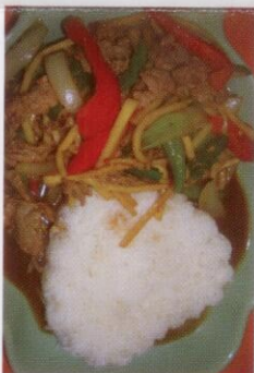
22. Nah Pad Prig