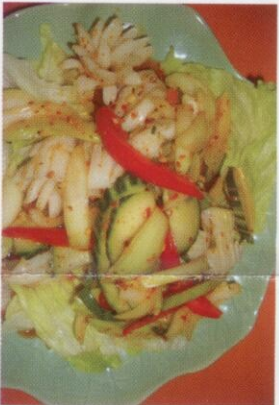
27. Pla Prew Wan