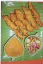
36. Gai Satay