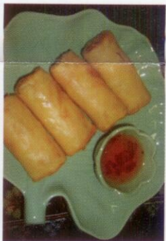
4. Pao Pia Thod