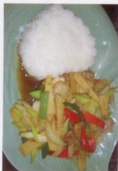
11. Ped Pad Prig