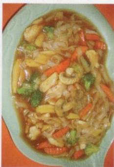
50. Lad Nah Gai/Muh