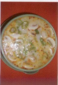
2. Tom Kha Gai